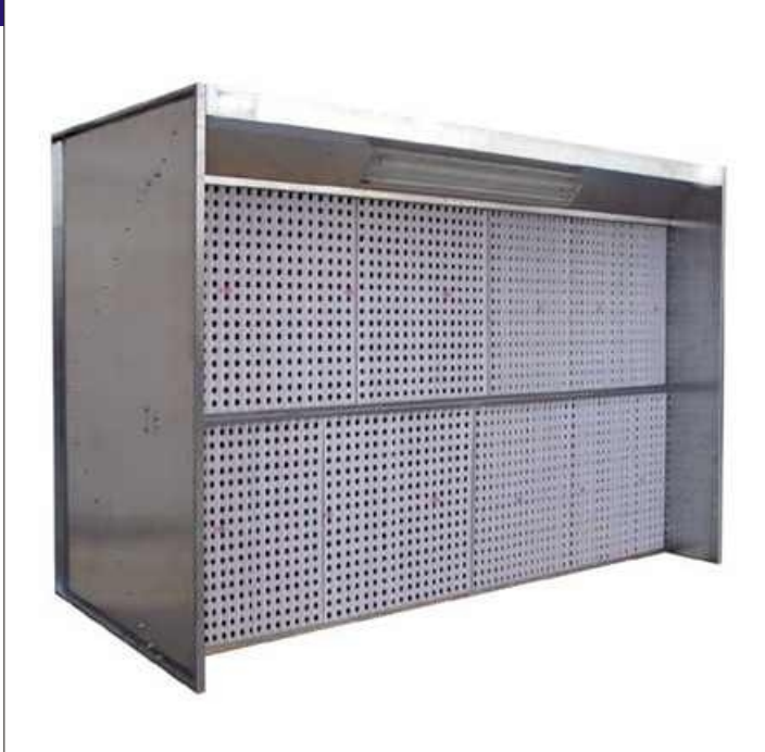
Abbildung: Ausführung NA ohne Seitenwände

Absauganlage für : mittleres und großes Lackieraufkommen