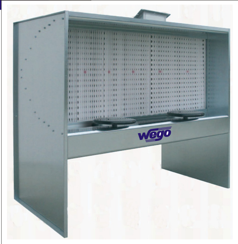
Abbildung: "Minidry 2"